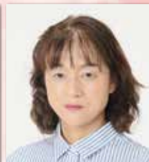
株式会社つじヶ丘在宅総合センター 代表取締役