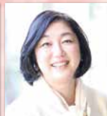
株式会社コメディックつばき グランヒルズ阿見 施設長