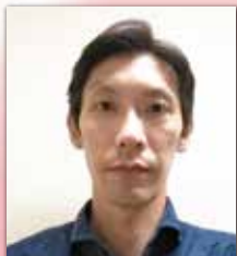
厚生労働省 老健局 老人保健課 看護係長

「包括報酬型」在宅サービス事業者交流会 9月5日(土) PM6:30～PM8:30 会費6,600円(税込) 全国町村会館 東京都千代田区永田町1丁目11-35 TEL 03-3581-0471