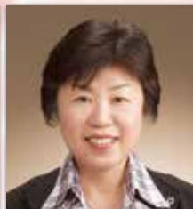
公益社団法人日本看護協会 副会長