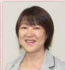
セントケア神奈川株式会社 神奈川事業部 看護小規模・訪問看護機能担当 課長