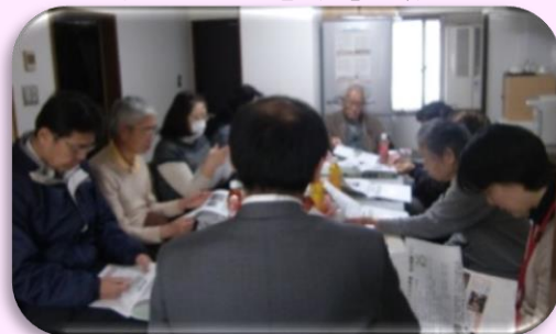
家族会での「勉強会」の様子

もしもの時、を考え、特に高齢者は自分の考え方、子どもたちの考えなど、笑って話せるうちに話し合っておくことが望ましいです。